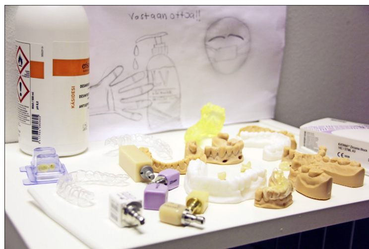
Ilari Tyni korjaa hampaita keraamisilla materiaaleilla.

Hänen mukaansa suomalaisten kannattaisi opetella lankaamaan hampaita, pesemään ne kaksi kertaa päivässä ja käymään säännöllisesti hammaslääkärisä. Hän ei